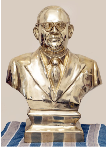
माजलगाव : प्रतिनिधी